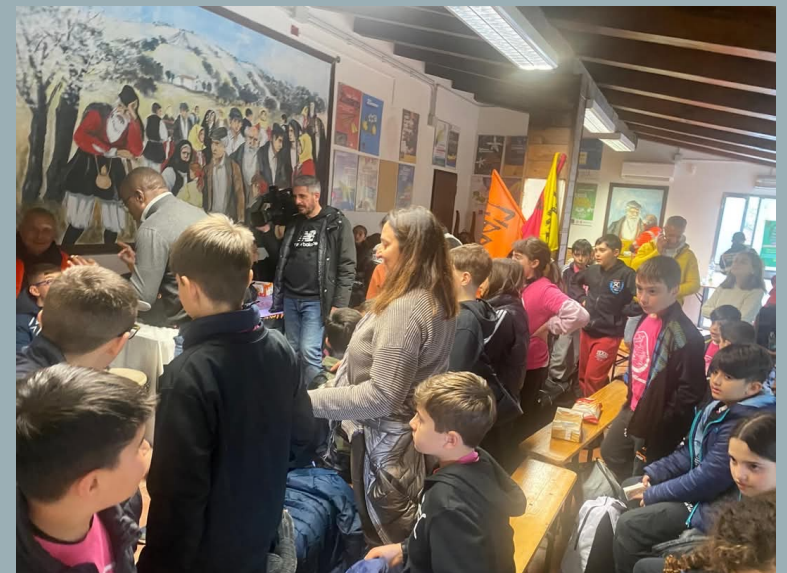
CLASSI 5 A e 5 B Via Sestu Scuola Primaria "Monsignor Saba" Elmas

Grazie a Libera Sardegna e ai Presìdi territoriali per l'accoglienza e il loro costante e prezioso impegno.